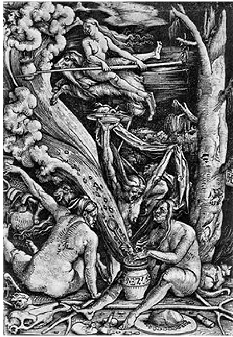
Hans Baldung Grien, De Heksen (1510).

Geloof in magie is een bijna universeel verschijnsel. Dat in de westerse beschaving een rationalistisch wereldbeeld ontstond en op termijn andere visies verdrong, is een unieke ontwikkeling in de menselijke geschiedenis. Te vaak wordt deze ontwikkeling als onvermijdelijk voorgesteld.